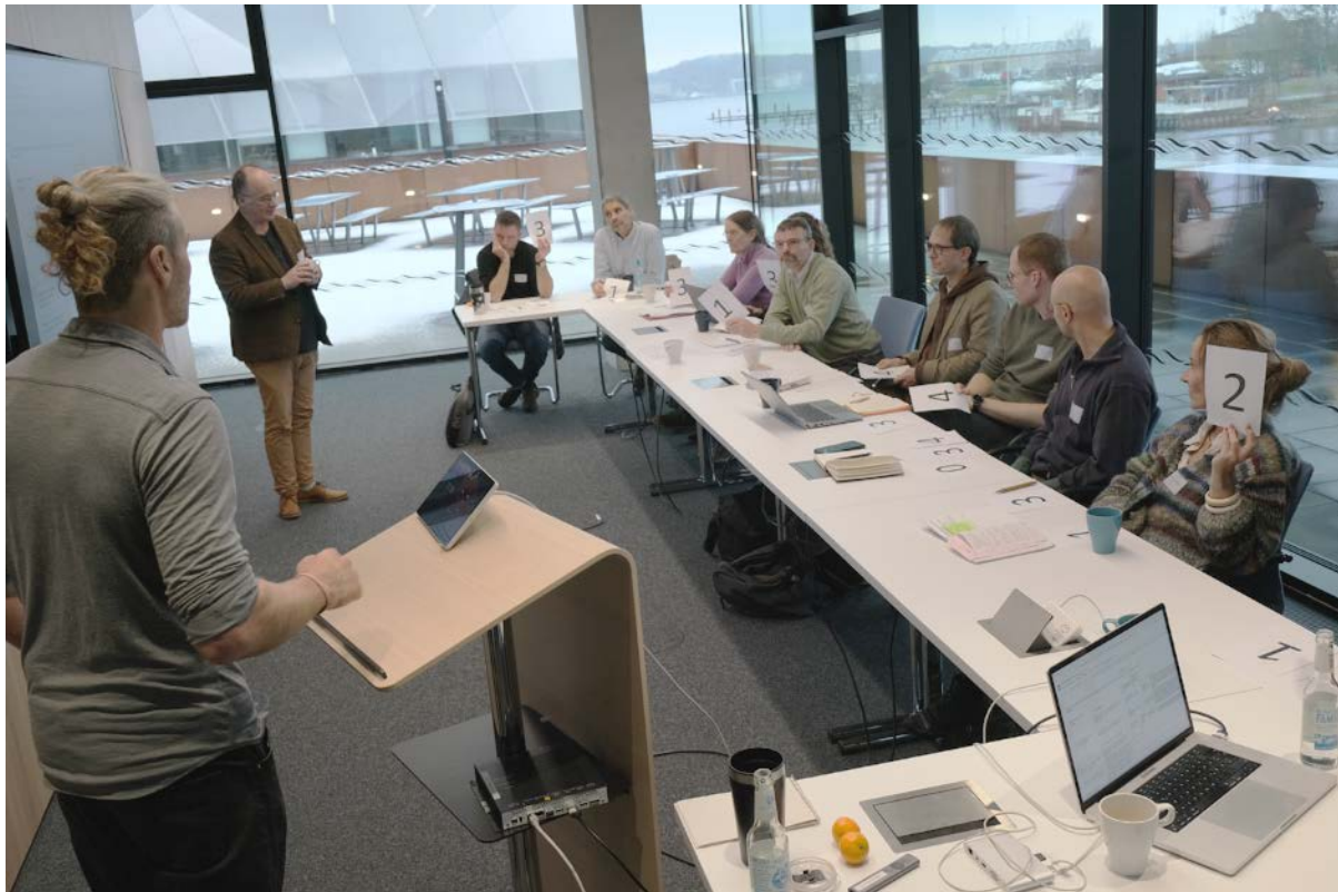
Gruppe 1 in der Diskussion.