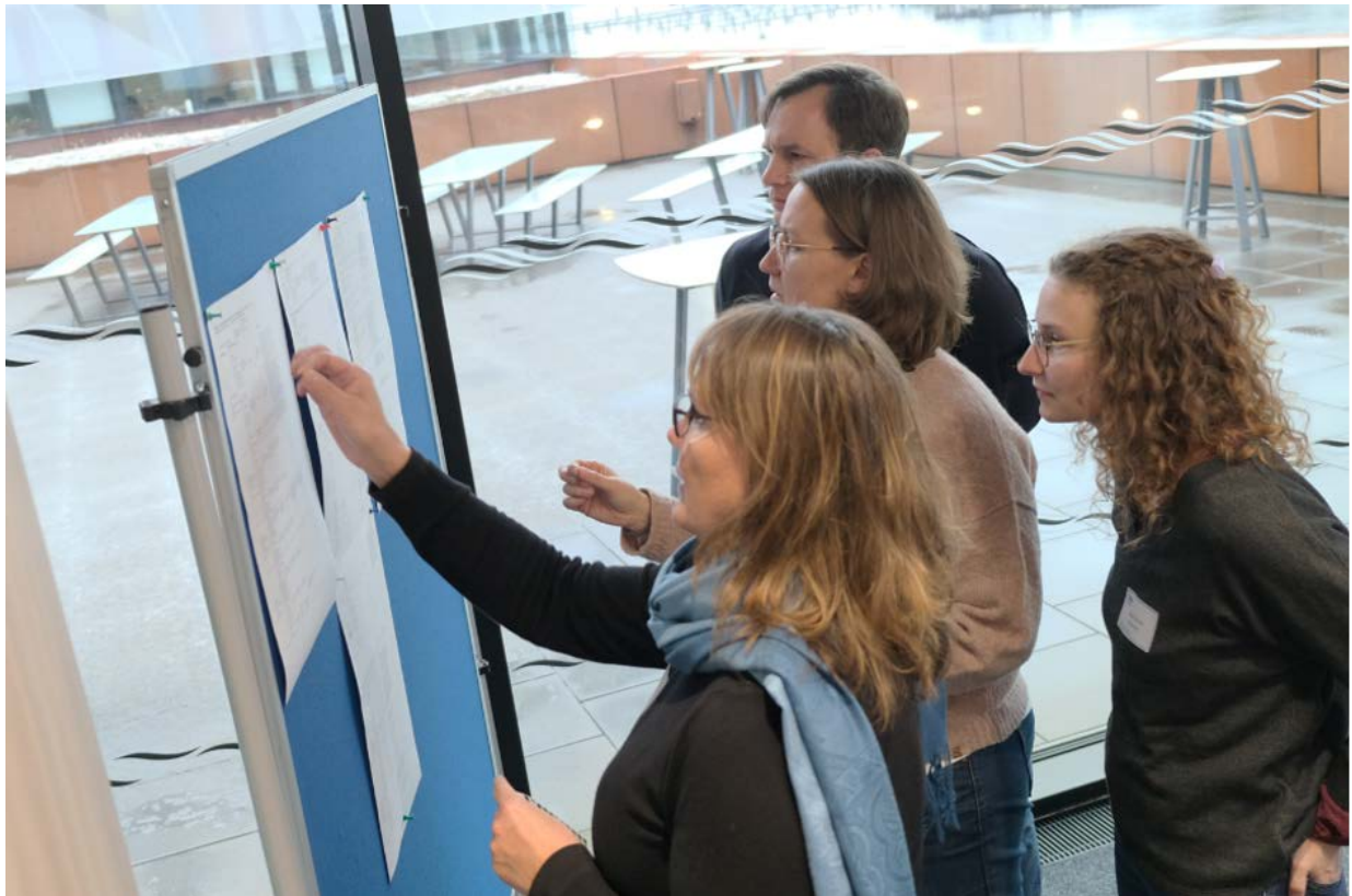
Die Punktevergabe in Gruppe 1.